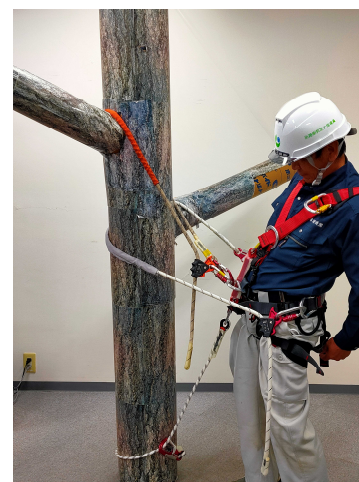
【ランヤードを掛けた時のイメージ】